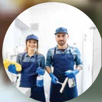
カップル募集 (ドライバー&メイド)