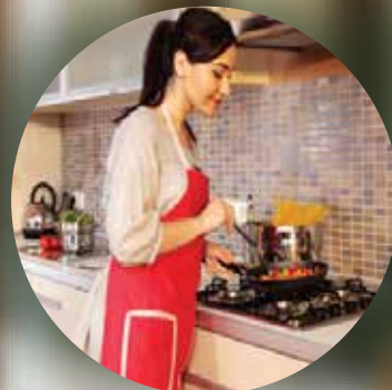
ハウスクック (男性/女性)