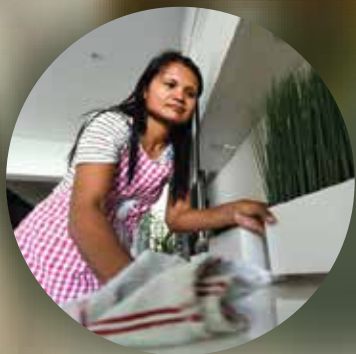
メイド/家事労働者